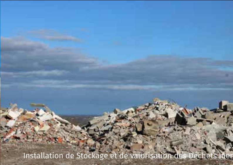
Installation de Stockage et de valorisation des Déchets Inertes à Navailles-Angos