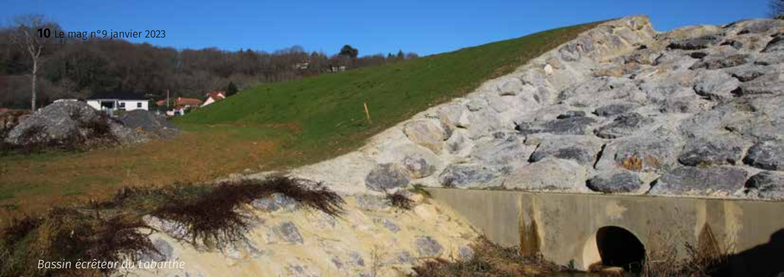
Bassin écreteur du Labarthe