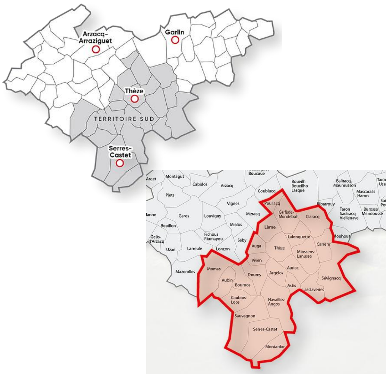
Périmètres de la Communauté de Communes des Luys en Béarn et du PLUi Territoire Sud.

La communauté des communes des Luys en Béarn (CCLB) dispose d'un Plan Local d'Urbanisme intercommunal (PLUi) Territoire Sud, approuvé le 6 février 2020, qui couvre 24 communes composant la partie sud du territoire intercommunal : Argelos, Astis, Aubin, Auga, Auriac, Bournos, Carrère, Caubios-Loos, Claracq, Doumy, Garlède-Mondebat, Lalonquette, Lasclaverie, Lème, Miossens-Lanusse, Momas, Montardon, Navailles-Angos, Pouliacq, Sauvagnon, Serres-Castet, Sévignacq, Thèze, Viven.