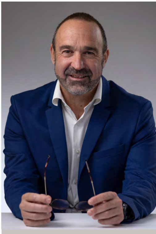
Bernard Peyroulet Président de la Communauté de communes des Luys en Béarn